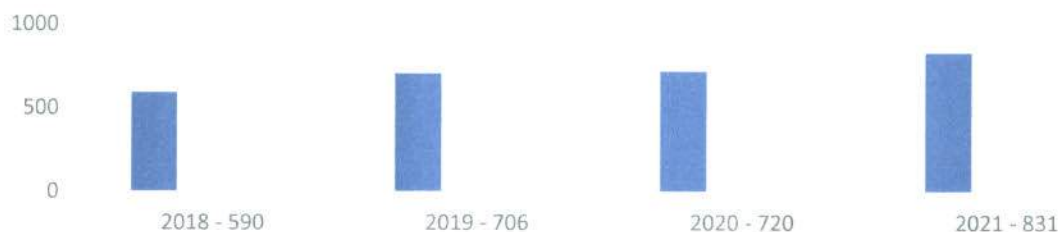
Zarejestrowani czytelnicy w MiGBP w Sobótce

Tendencję wzrostową czytelników korzystających z wypożyczalni ilustruje wykres: