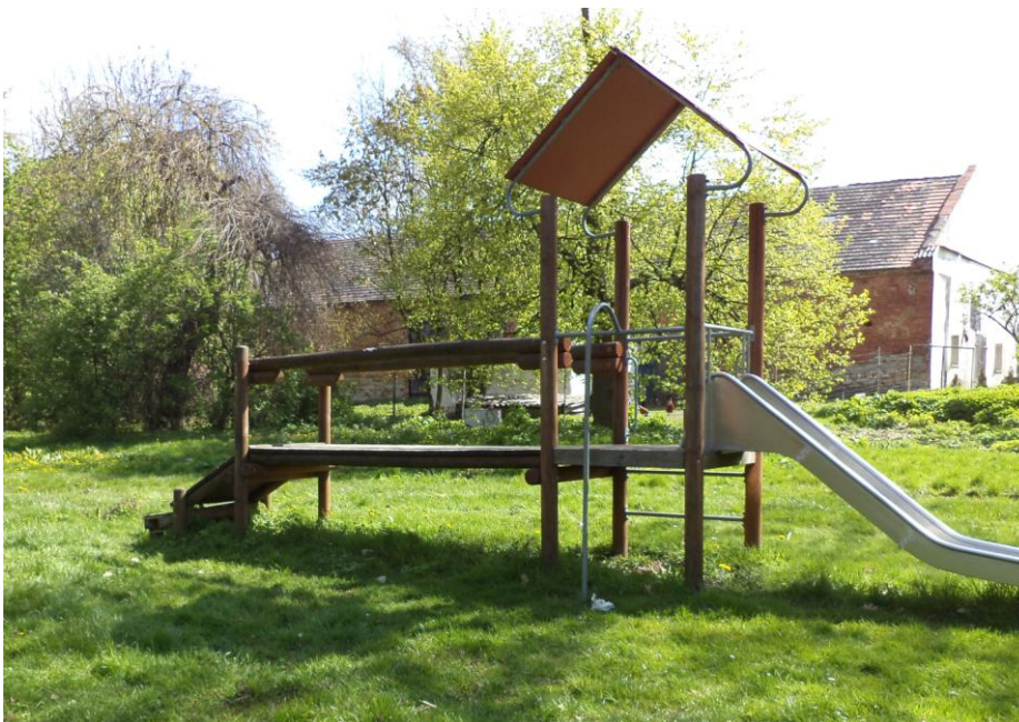
„Plac zabaw dla dzieci”