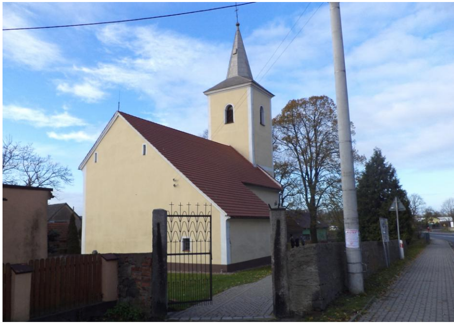
„Kościół pw. Wniebowzięcia NMP”