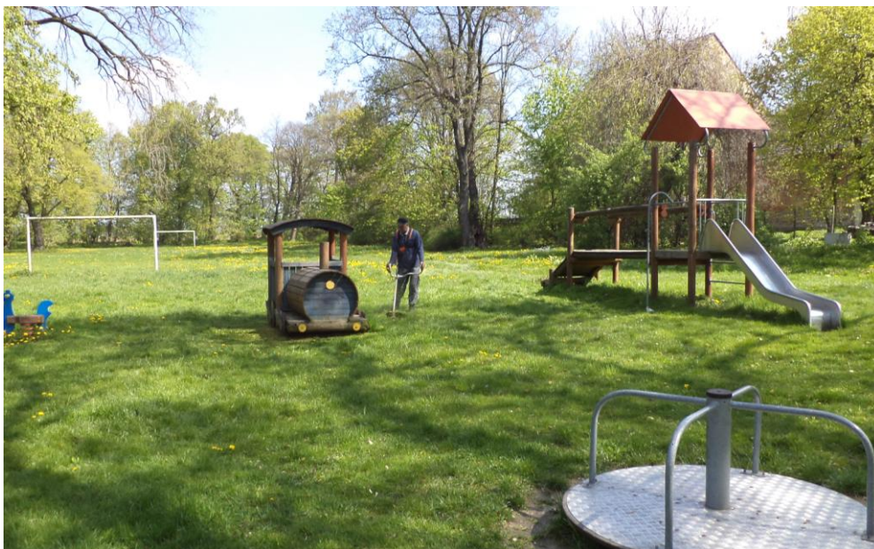
„Plac zabaw oraz boisko piłkarskie”