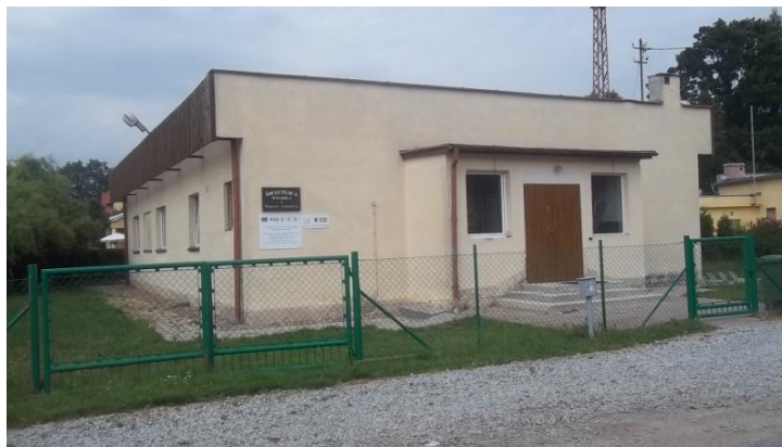
Rysunek 17 Świetlica wiejska