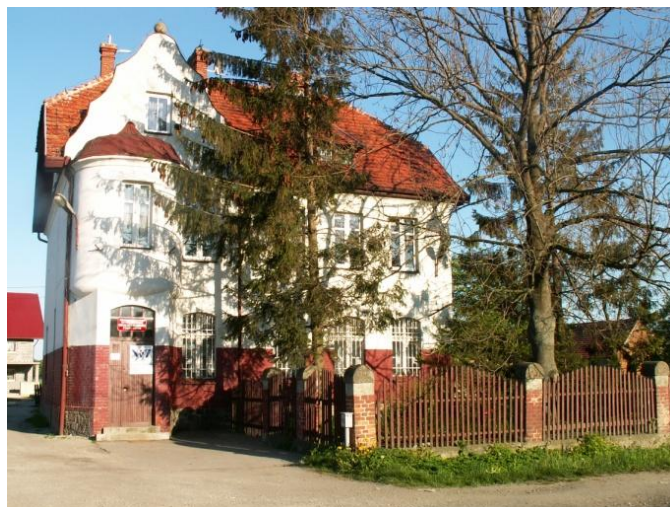
Rysunek 12 Wiejski Ośrodek Zdrowia