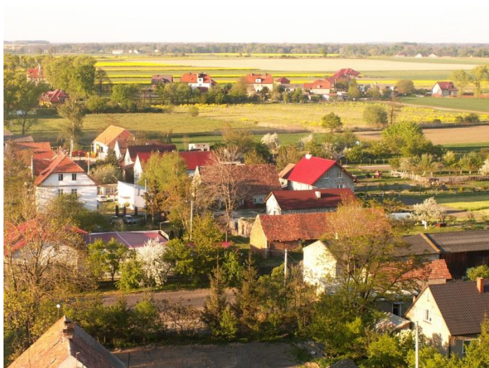
Rysunek 9 Dachy pokryte dachówką czerwoną i dach pokryty papą

Stan techniczny budynków mieszkalnych jest zróżnicowany. Większa część to obiekty w średnim stanie technicznym, ok. 20% jest w złym stanie i pozostałe ok. 15% w stanie dobrym. Rozkład tych obiektów w skali wsi jest różnorodny. Nie ma stref, gdzie budynki byłyby tylko w dobrym stanie technicznym, jak również nie ma obszarów, gdzie są tylko budynki zniszczone.