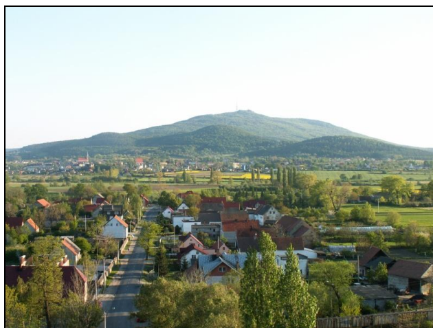
Rysunek 5 Zabudowa zwarta z widokiem na Ślężę

We wsi przeważa zabudowa przedwojenna, są to budynki o charakterystycznych spadzistych dachach symetrycznych. Jest kilka budynków z okresu lat 1945 - 1980 oraz budynki nowe. Charakter miejscowości nadają głównie budynki stare i to one budują wizerunek miejscowości. Kolorystyka elewacji budynków mieszkalnych to głównie odcienie bieli i szarości. Występuje zabudowa zwarta z widokiem na górę Ślężę. Większość budynków we wsi ma dachy o kącie nachylenia 45°, są też obiekty o dachach płaskich oraz pochylonych pod kątem 15° lub 30°. Można powiedzieć, że budynki o połaciach dachowych pochylonych pod kątem 45° są elementem charakterystycznym danej miejscowości. Budynki w większości są dwukondygnacyjne z poddaszem użytkowym, pokryte dachówką w kolorze czerwonym.