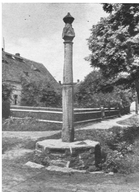
Rogau-Rosenau - Staupsäule