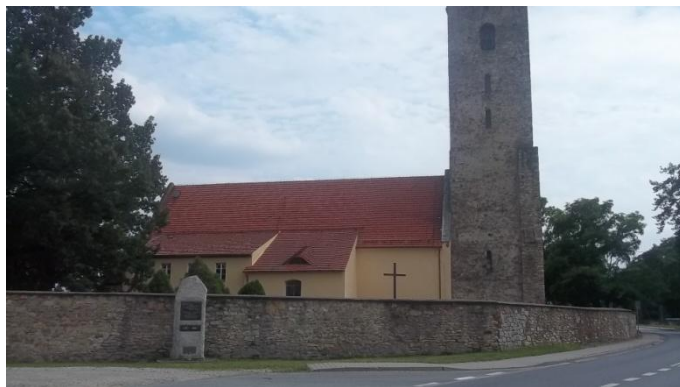
Rysunek 15 Kościół parafialny p.w. św. Jana Chrzciciela