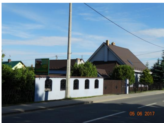
Rysunek 10 Przykład nr 1 zadbanej posesji

Mieszkańcy coraz bardziej dbają o estetykę swoich posesji.