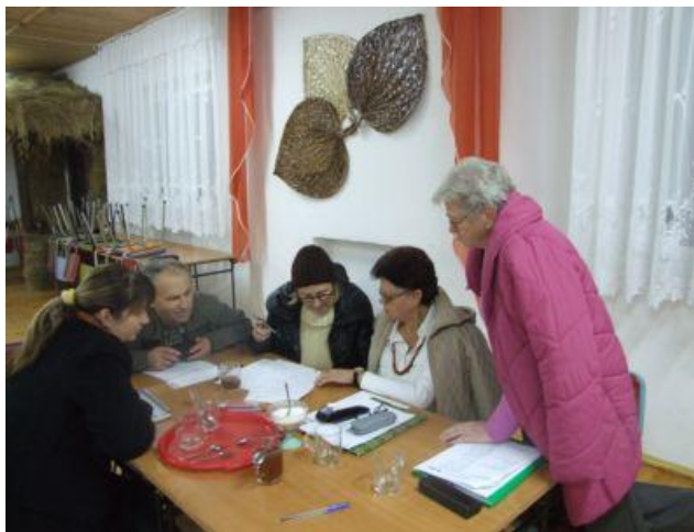
Rysunek 19 Praca nad Strategią Rozwoju Wsi