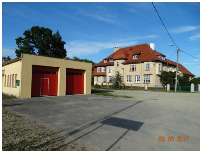
Rysunek 16 Remiza i Szkoła Podstawowa