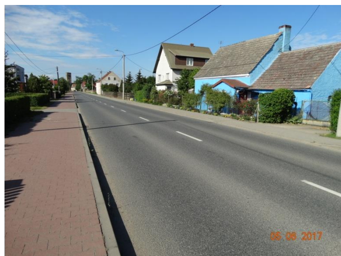
Rysunek 7 Elewacje w różnych kolorach