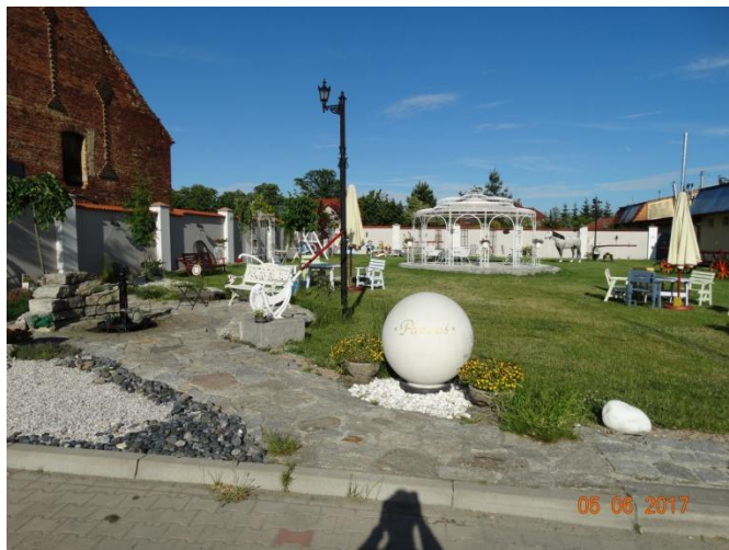
Rysunek 14 Piekarnia - cukiernia - ujęcie nr 2