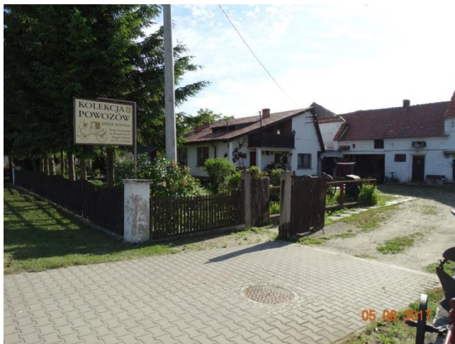
Rysunek 18 Prywatna kolekcja powozów konnych

Na obrzeżach wsi znajdują się dwa boiska. Na jednym z nich odbywają się wszystkie duże wiejskie imprezy o charakterze plenerowym.