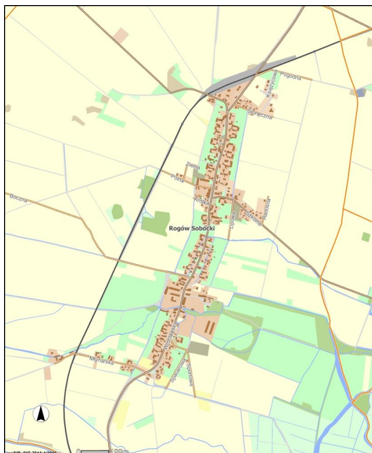
Rysunek 1 Układ przestrzenny wsi Rogów Sobócki

W Rogowie Sobóckim występuje największa powierzchnia użytków rolnych w gminie i jest to 1.311 hektarów i największa powierzchnia gruntów sektora prywatnego - 1.117 ha.