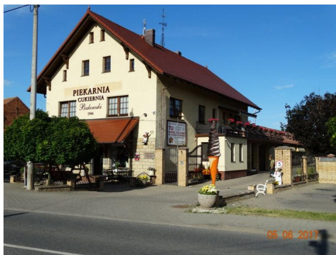
Rysunek 13 Piekarnia - cukiernia - ujęcie nr 1