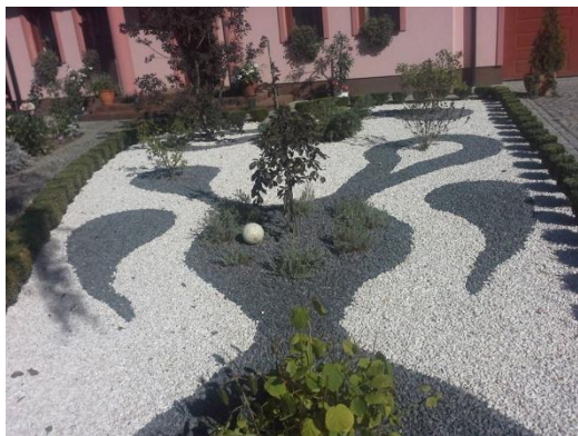
Rysunek 11 Przykład nr 2 zadbanej posesji