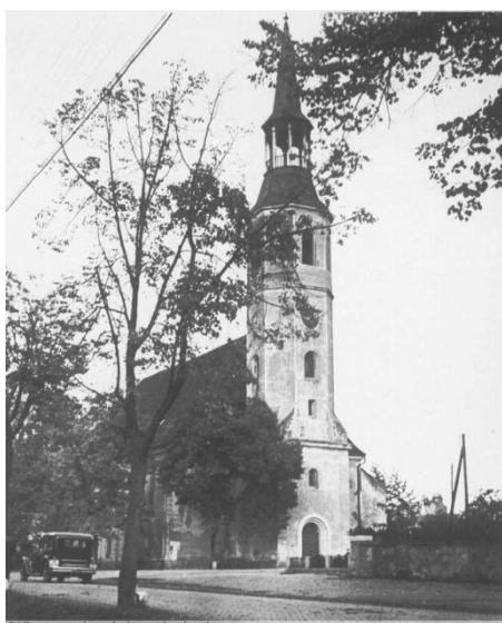
Rysunek 3 Nie istniejący już Kościół Ewangelicki

W latach 1852 - 1945 Rogau Rosenau należał do rodziny hrabiów Puckler.