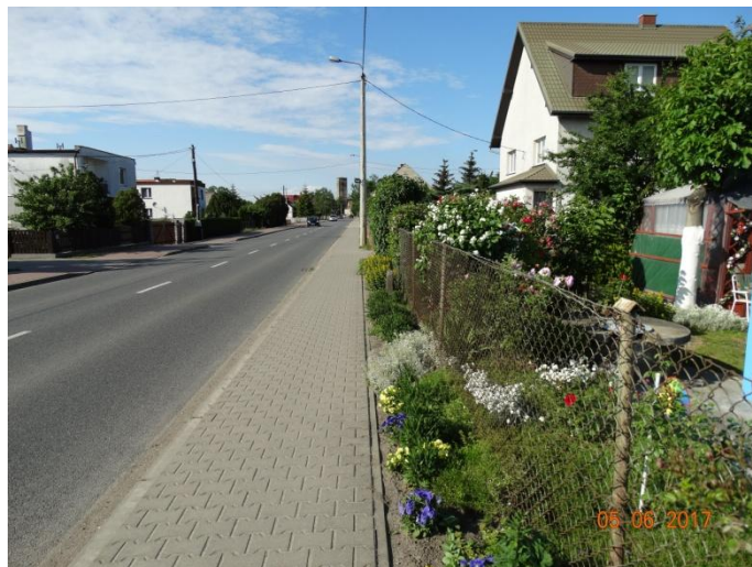
Rysunek 6 Elewacje w kolorze białym