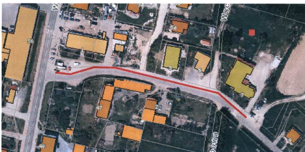
Rysunek 3 Budowa chodnika w Rogowie Sobóckim