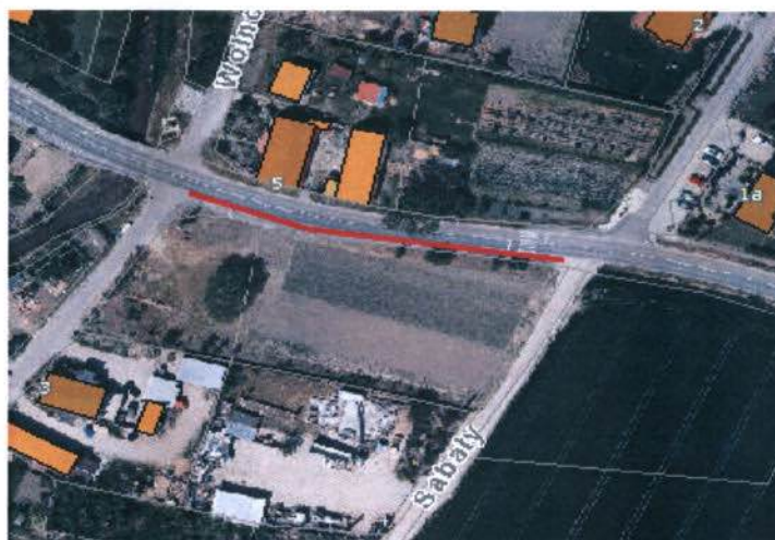
Rysunek 2 Budowa chodnika w Świątnikach