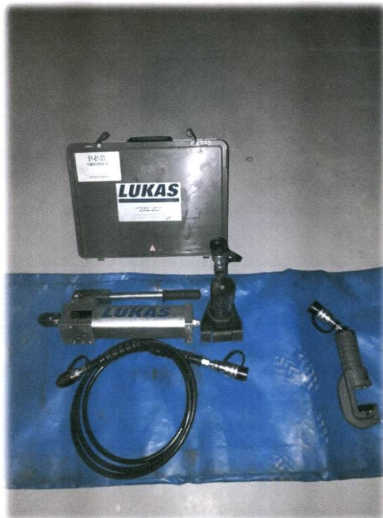
Fot.: Wyważarka do drzwi dla Ochotniczej Straży Pożarnej w Księginicach Małych.