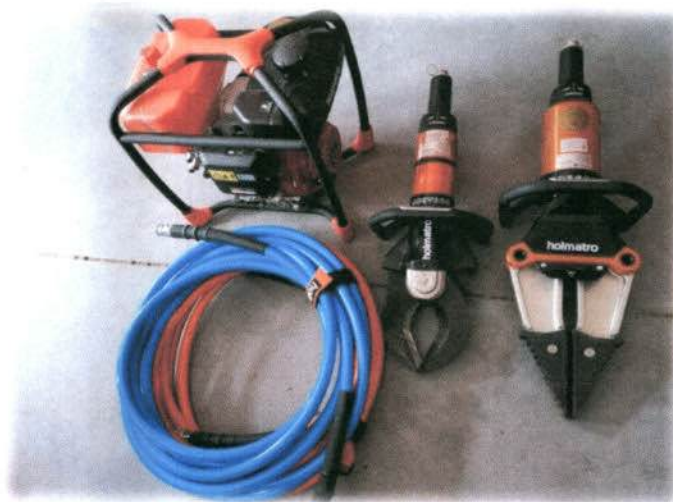
Fot.: Średni zestaw narzędzi hydraulicznych dla Ochotniczej Straży Pożarnej w Rogowie Sobóckim

Dotacja Komendanta Głównego PSP – 36 000,00 zł