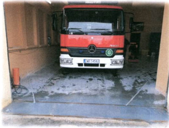
Fot.: Remiza Ochotniczej Straży Pożarnej w Rogowie Sobóckim

Dotacja Komendanta Głównego PSP – 14 904,00 zł