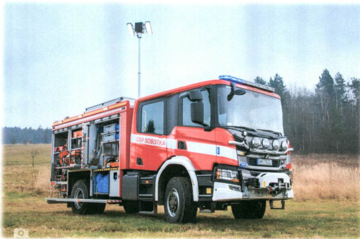
Fot: Średni samochód ratowniczo – gaśniczy dla OSP w Sobótce