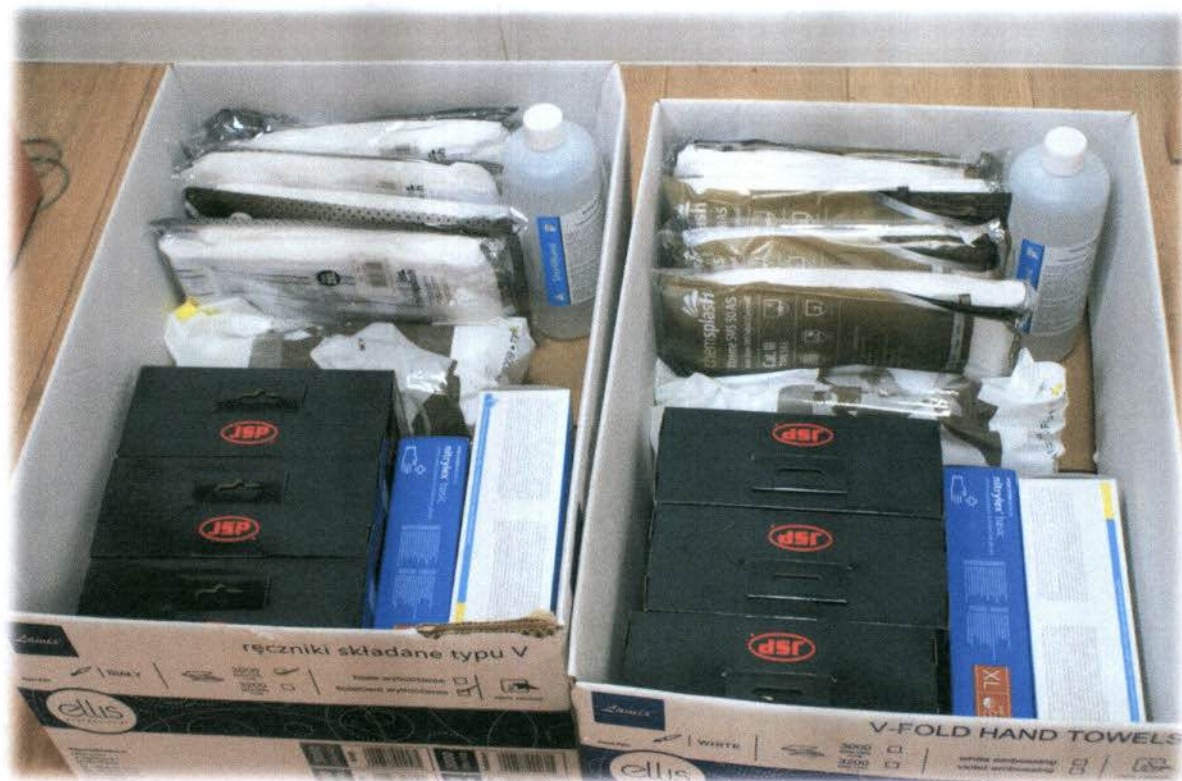
Fot.: Środki ochrony indywidualnej.

Kluczowym elementem walki z zagrożeniem wywołanym przez nowego wirusa SARS – CoV – 2 były powszechne działania edukacyjno – informacyjne oraz wspieranie jednostek straży pożarnej, policji, jednostek ochrony zdrowia poprzez przekazywanie środków ochrony indywidualnej.