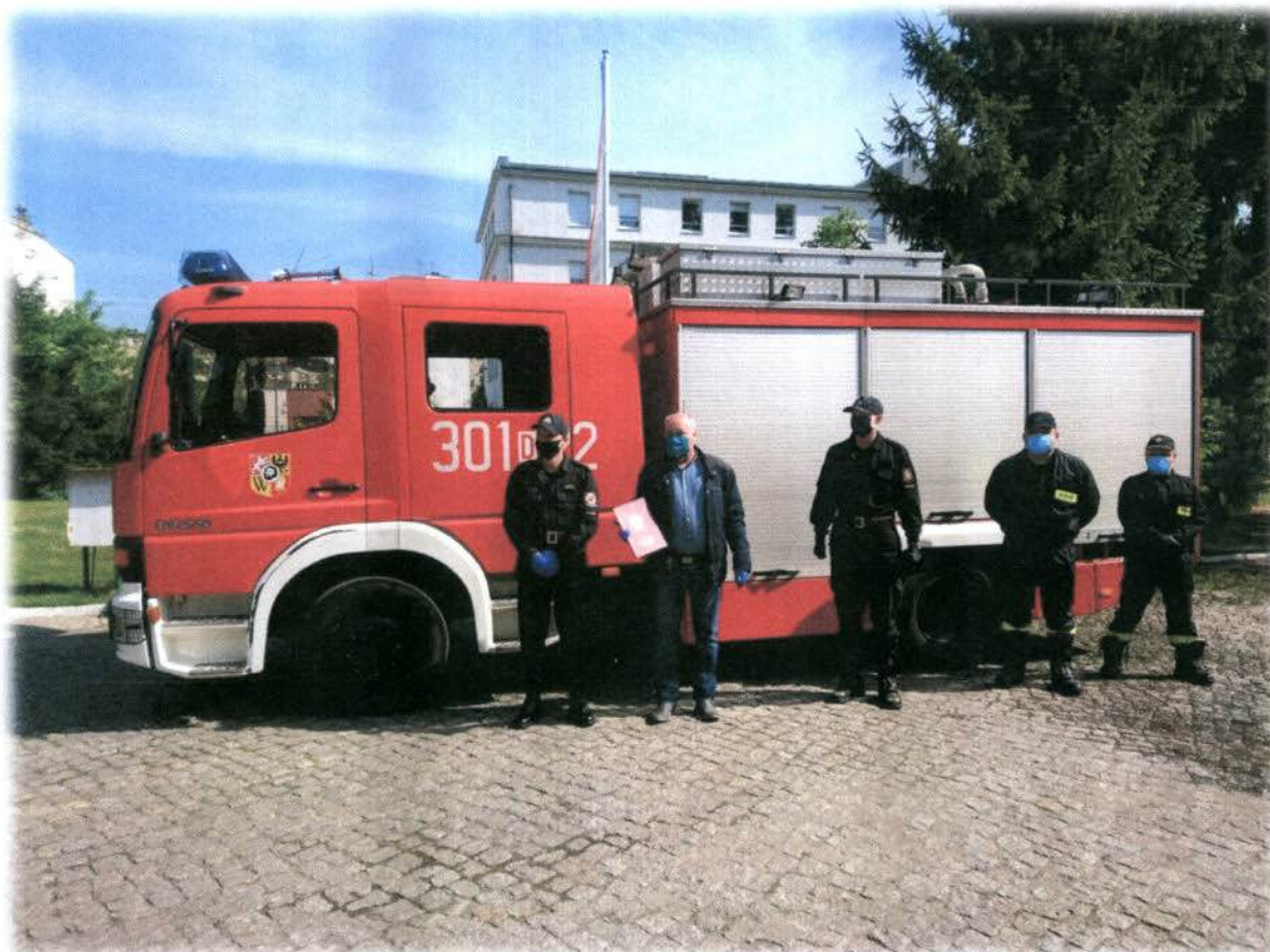
Fot.: Średni samochód ratowniczo – gaśniczy będący na wyposażeniu OSP w Rogowie Sobóckim.

Samochód wyprodukowany został w 2001 r. Posiada napęd terenowy 4x2, zbiornik na wodę o pojemności 2500 l oraz zbiornik na środek pianotwórczy o pojemności 200 l. Pozyskanie w/w samochodu wpłynęło na poprawę gotowości bojowej jednostki.