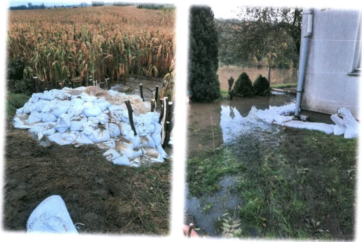
Fot.: Podtopienia – Gmina Sobótka 2020