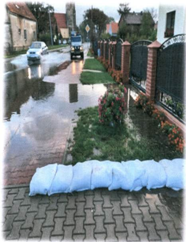
Fot.: Podtopienia – Gmina Sobótka 2020