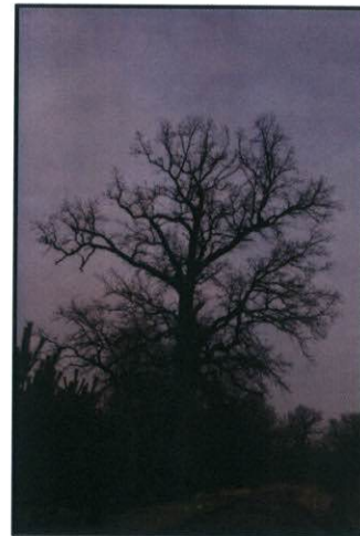
Przykład drzew pomnikowych