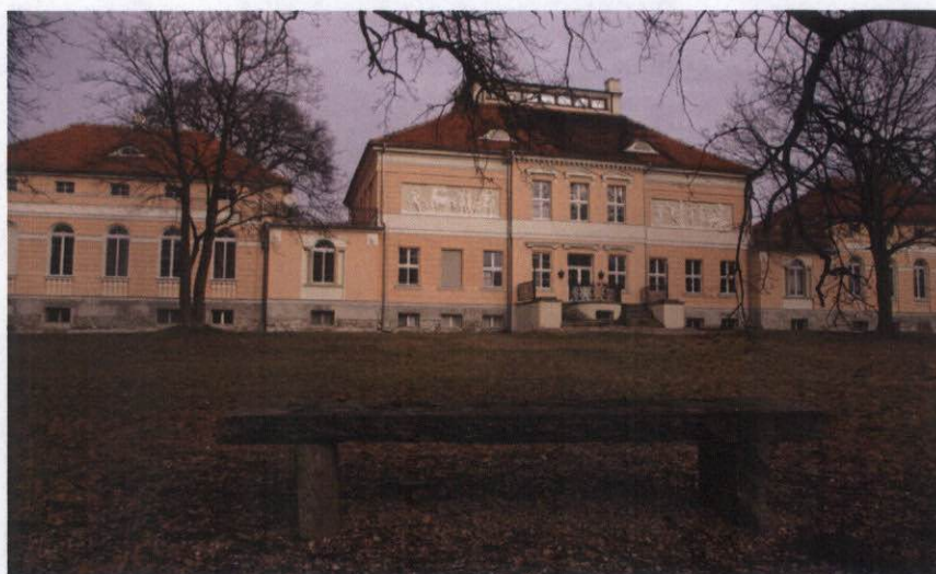
Zespół pałacowo-dworski Miroślawiczki