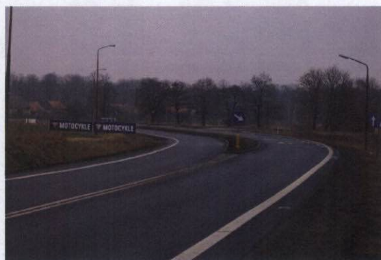
Rozwidlenie dróg, krajowa 35