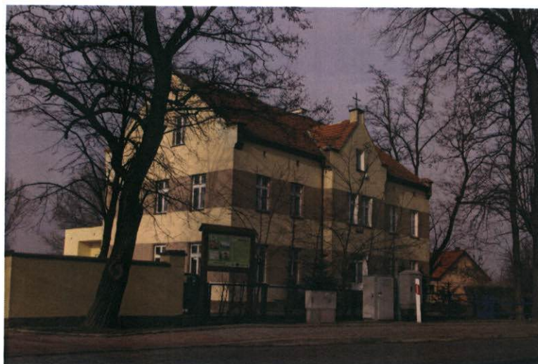
Budynek dawnej szkoły