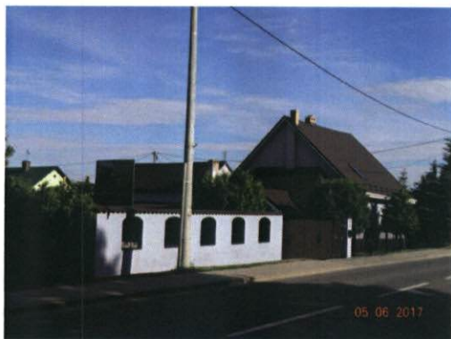
Rysunek 10 Przykład nr 1 zadbanej posesji

Mieszkańcy coraz bardziej dbają o estetykę swoich posesji.