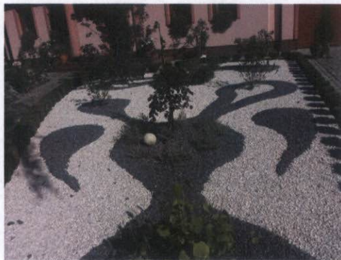
Rysunek 11 Przykład nr 2 zadbanej posesji