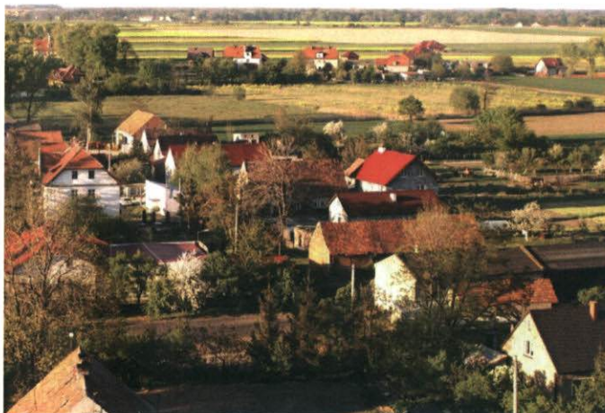
Rysunek 9 Dachy pokryte dachówką czerwoną i dach pokryty papą

Stan techniczny budynków mieszkalnych jest zróżnicowany. Większa część to obiekty w średnim stanie technicznym, ok. 20% jest w złym stanie i pozostałe ok. 15% w stanie dobrym. Rozkład tych obiektów w skali wsi jest różnorodny. Nie ma stref, gdzie budynki byłyby tylko w dobrym stanie technicznym, jak również nie ma obszarów, gdzie są tylko budynki zniszczone.