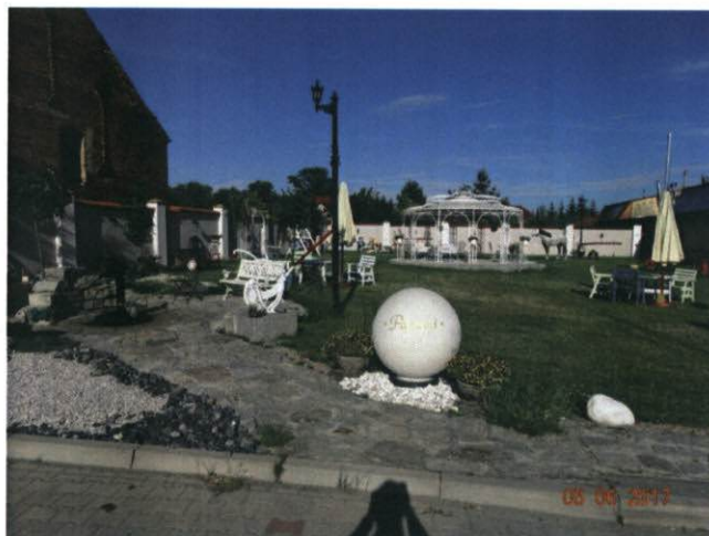
Rysunek 14 Piekarnia - cukiernia - ujęcie nr 2