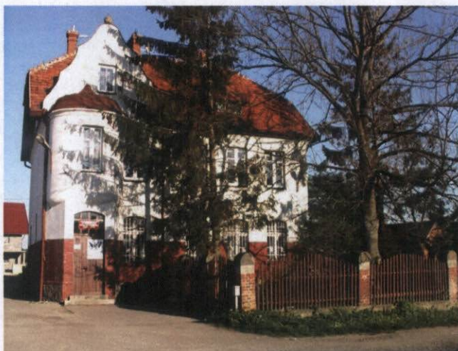
Rysunek 12 Wiejski Ośrodek Zdrowia