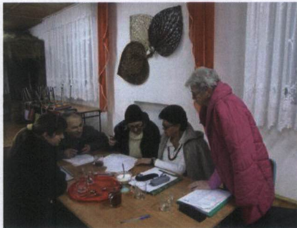
Rysunek 19 Praca nad Strategią Rozwoju Wsi