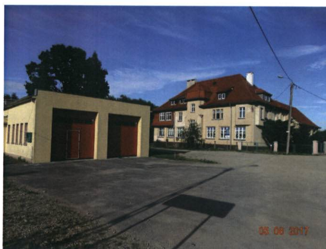
Rysunek 16 Remiza i Szkoła Podstawowa