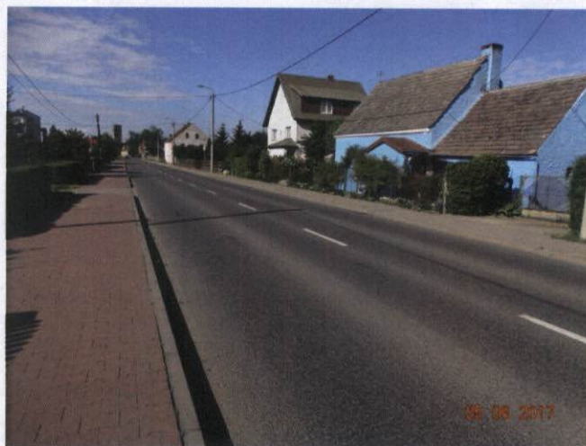
Rysunek 7 Elewacje w różnych kolorach