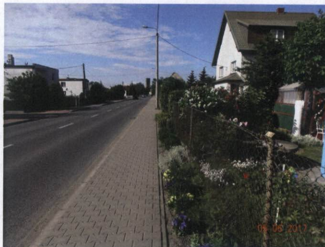
Rysunek 6 Elewacje w kolorze białym