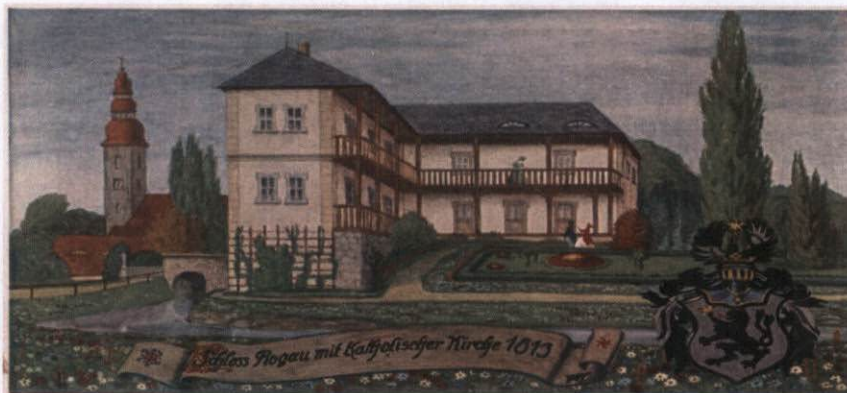
Rysunek 2 Dwór w roku 1813 z widokiem na kościół katolicki

W latach 1852 - 1945 Rogau Rosenau należał do rodziny hrabiów Puckler.