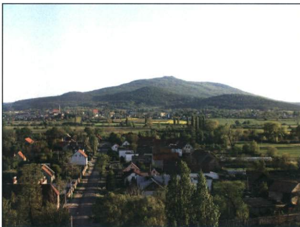
Rysunek 5 Zabudowa zwarta z widokiem na Ślężę

We wsi przeważa zabudowa przedwojenna, są to budynki o charakterystycznych spadzistych dachach symetrycznych. Jest kilka budynków z okresu lat 1945 - 1980 oraz budynki nowe. Charakter miejscowości nadają głównie budynki stare i to one budują wizerunek miejscowości. Kolorystyka elewacji budynków mieszkalnych to głównie odcienie bieli i szarości. Występuje zabudowa zwarta z widokiem na górę Ślężę. Większość budynków we wsi ma dachy o kącie nachylenia 45°, są też obiekty o dachach płaskich oraz pochylonych pod kątem 15° lub 30°. Można powiedzieć, że budynki o połaciach dachowych pochylonych pod kątem 45° są elementem charakterystycznym danej miejscowości. Budynki w większości są dwukondygnacyjne z poddaszem użytkowym, pokryte dachówką w kolorze czerwonym.