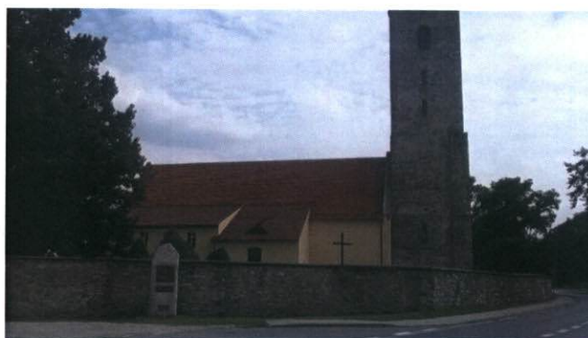
Rysunek 15 Kościół parafialny p.w. św. Jana Chrzciciela