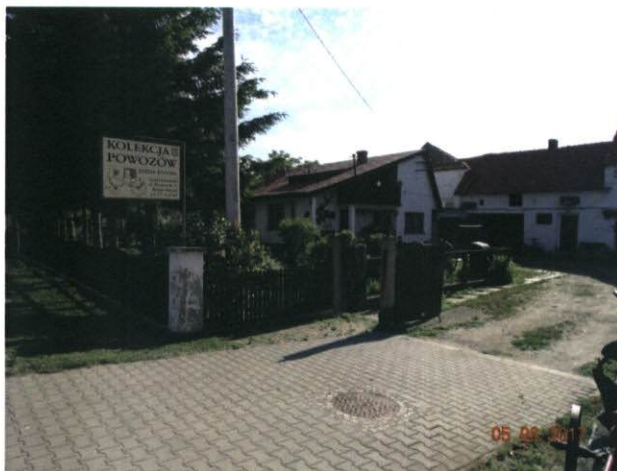
Rysunek 18 Prywatna kolekcja powozów konnych

Na obrzeżach wsi znajdują się dwa boiska. Na jednym z nich odbywają się wszystkie duże wiejskie imprezy o charakterze plenerowym.