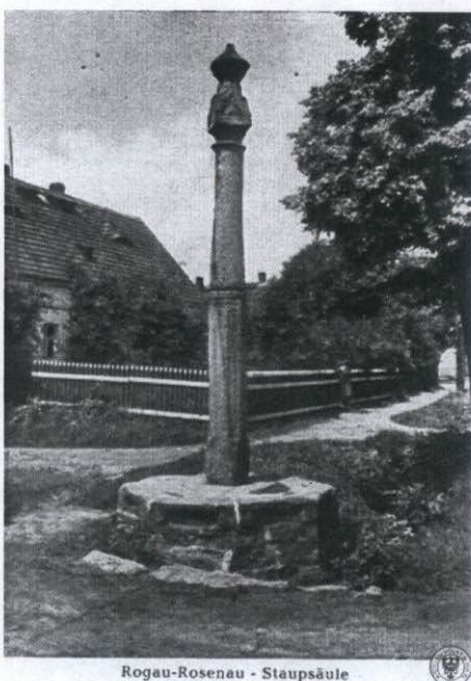
Rogau-Rosenau - Staupensäule