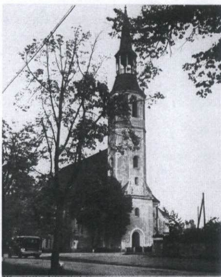
Rysunek 3 Nie istniejący już Kościół Ewangelicki

W latach 1852 - 1945 Rogau Rosenau należał do rodziny hrabiów Puckler.