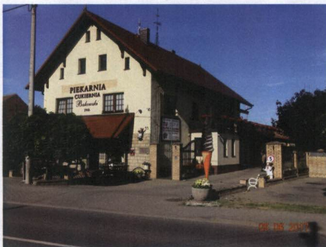
Rysunek 13 Piekarnia - cukiernia - ujęcie nr 1