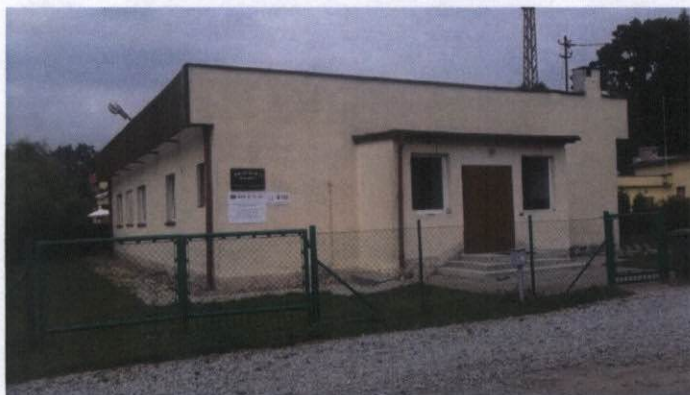
Rysunek 17 Świetlica wiejska