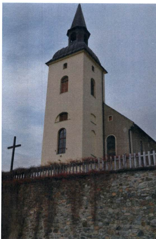
Kościół filialny p.w. Matki Boskiej Różańcowej