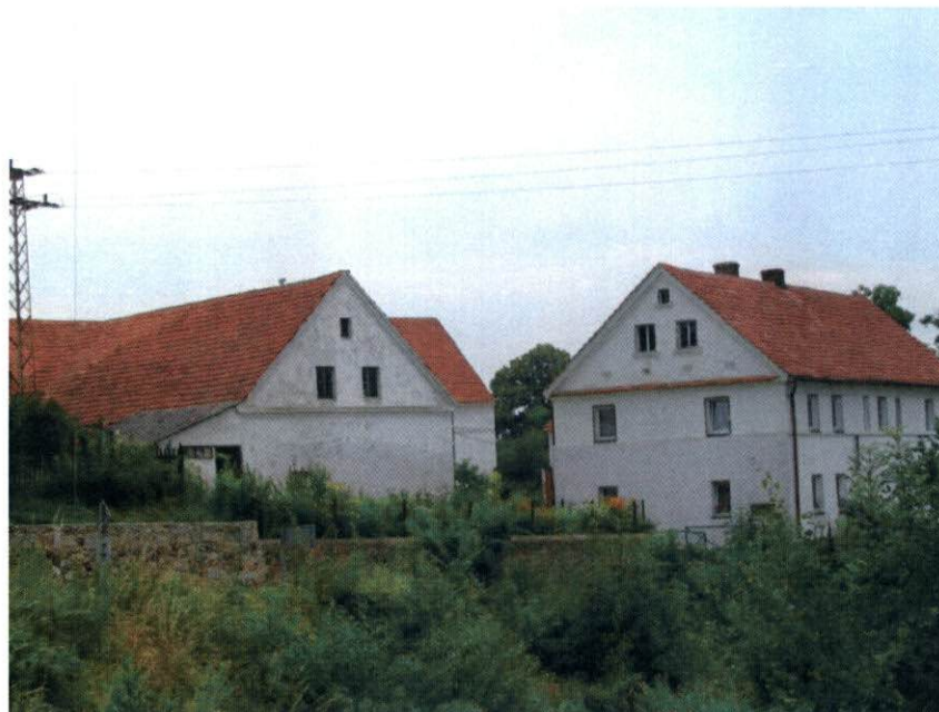
Budynki z elewacją w kolorze białym