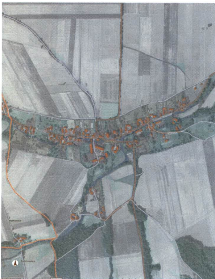
Układ przestrzenny wsi

Najbardziej charakterystycznym budynkiem Księżnic Małych jest klasycystyczny kościół pw. Matki Boskiej Różańcowej zbudowany w XVIII w. jako kościół ewangelicki. Świątynia założona jest na planie prostokąta, bez wydzielonego prezbiterium. Nakrywa ją dwuspadowy dach. Wieżę kościelną, o podstawie kwadratu, wieńczy hełm z latarnią nakrytą ostrosłupem ośmiobocznym, zakończonym krzyżem na kuli. W wieży jest wejście główne do kościoła. We wnętrzu obiektu znajduje się klasycystyczna drewniana polichromowana ambona, chrzcielnica kamienna z poł. I XIX w. i neogotycki ołtarz główny z pocz. XX w. W sąsiedztwie kościoła usytuowana jest XVIII – wieczna plebania nakryta mansardowym dachem z lukarnami.