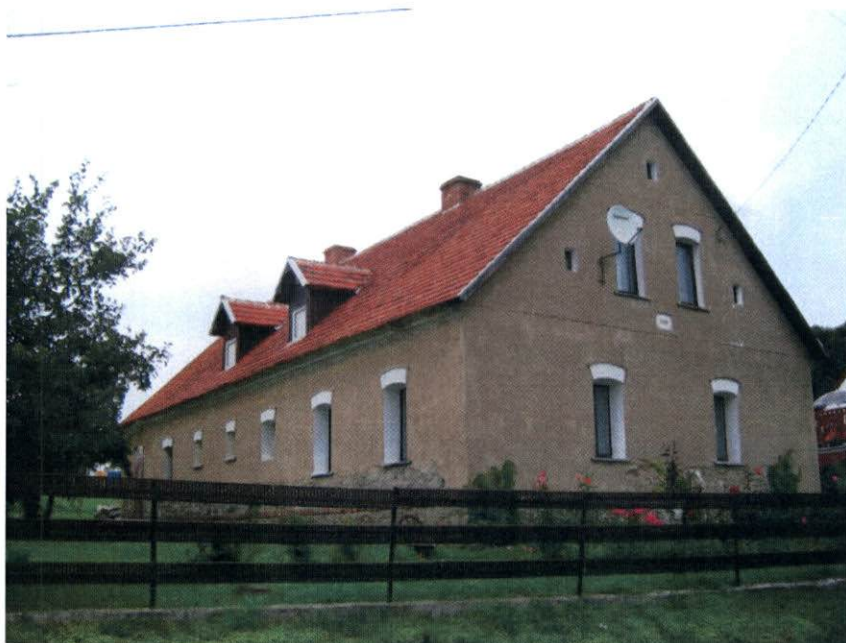
Połaci dachowe pod kątem 45° pokryte czerwoną dachówką