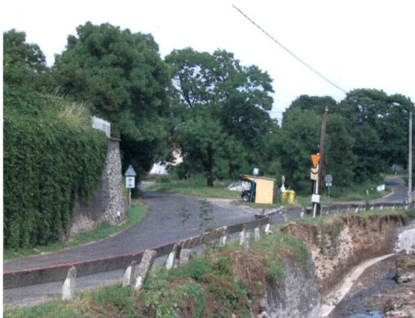
Centrum miejscowości z murem okalającym wzgórze kościelne, rozwidleniem dróg oraz Potokiem Sulistrowickim