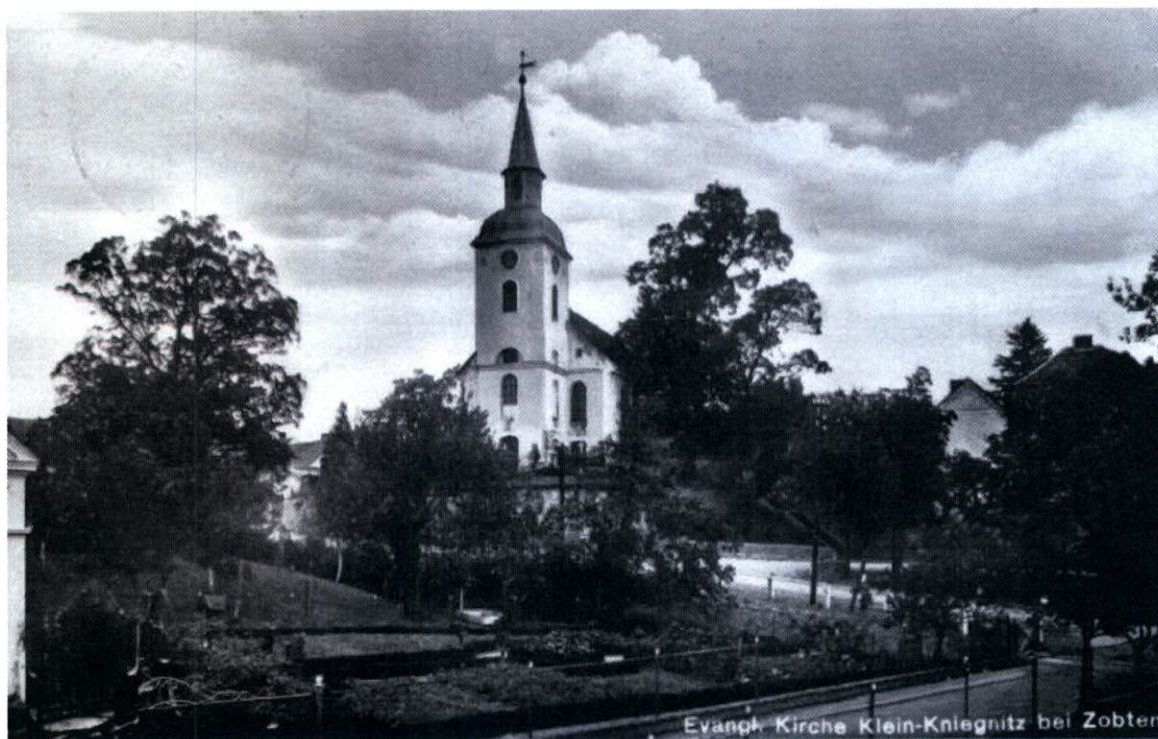
Centrum wsi z rozwidleniem dróg w kierunku Przemilowa i Świątnik

Druga kolonia Schieferstein (dziś wieś Przemilów) w 1845r. liczyła 110 mieszkańców osiadłych w 40 domach. Kolonia ta w swym zasadniczym układzie (wzdłuż rozwidlonych dróg) figuruje już na mapie Wredego.