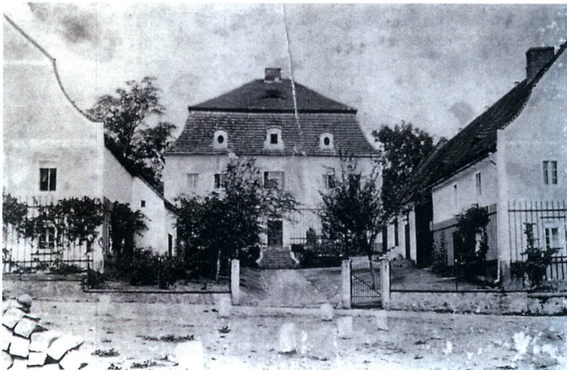
Widok plebanii z zabudową towarzyszącą