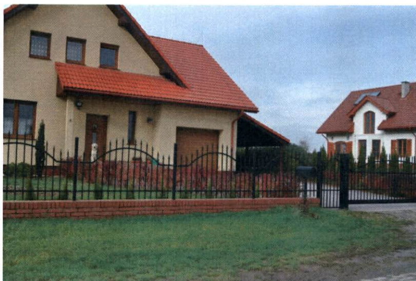
Nowopowstała zabudowa jednorodzinna