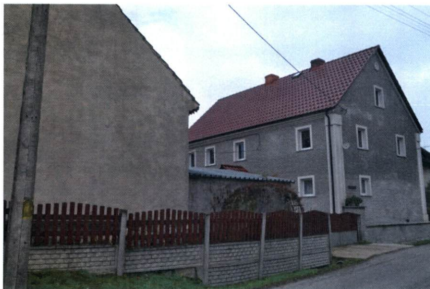
Budynki z elewacją w kolorze szarym