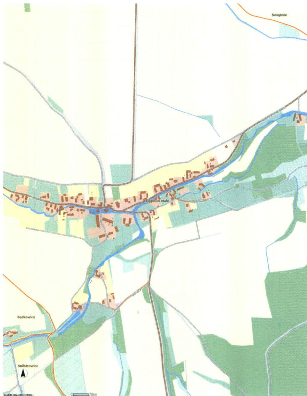
Układ przestrzenny wsi Księginice Małe