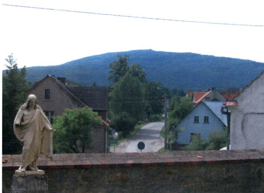
Układ zabudowy wiejskiej